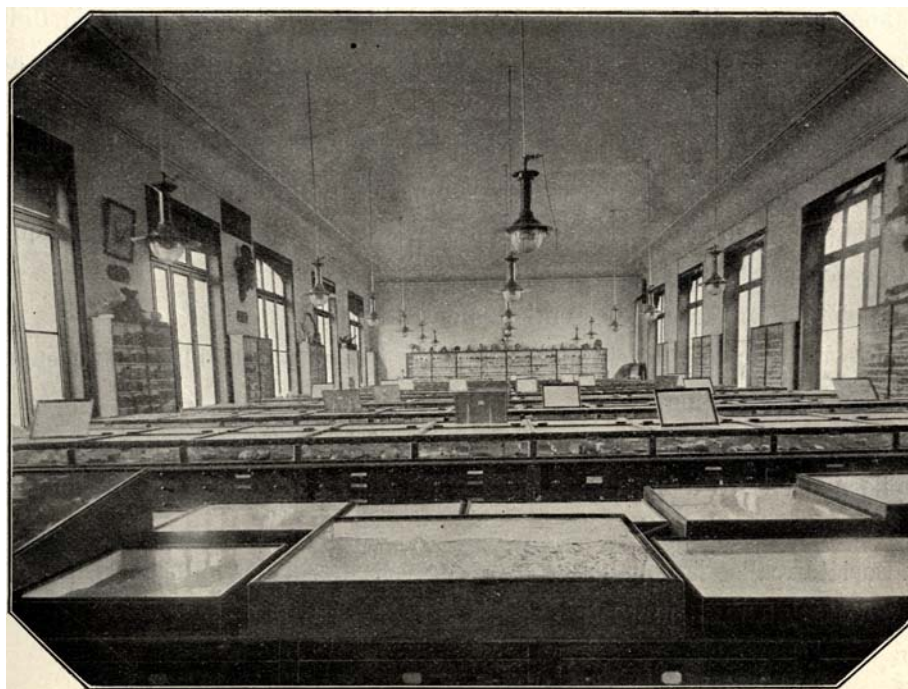
Fig. 1. — Musée Gosselet : principale salle de réserve des collections géologiques (1970).

Sous l'impulsion de Sophie Beckary, Conservatrice des Musées de Géologie et Houiller, des échantillons plus specta-