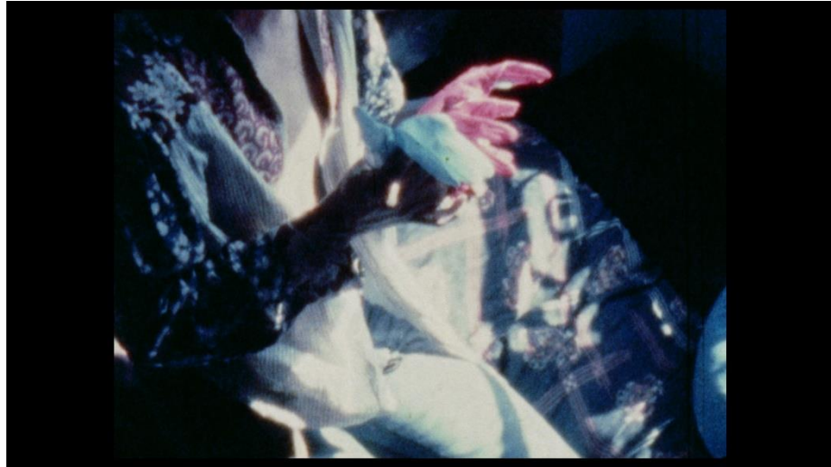
Figure 1 Michel Nedjar, Le gant de l'autre , 1977, Super 8, coul., sil., 15 min 20s. © Michel Nedjar