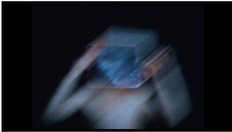
Figure 3 Michel Nedjar, Gestuel , 1978, Super 8, coul., son., 20 min. © Michel Nedjar

poing, comme un prolongement du corps. Ici encore, l'œil voit avec la main, à tâtons, presque aveugle dans l'obscurité de la prise de vue. Plusieurs portraits de Gaël Badaud se succèdent avec des accessoires différents : un filet vert, une bande velpeau, un masque à gaz, un morceau de tissu rouge, un miroir ou encore un ruban en plastique. Il se couvre le visage de ces différents accessoires et dans la scansion répétitive des gestes, le corps subit une métamorphose à vue. Celle-ci est rythmée par des coupes noires et une bande sonore qui se présente comme un collage discrédant de sons extraits de jeux vidéos de combats exacerbant l'aspect chaotique de l'image. Ici, la texture des accessoires utilisés se donne moins en surface que comme un masque qui altère le visage et le corps tout entier, le contorsionne, le colore, l'informe et le déforme. Le corps entier devient plastique, se confond avec l'accessoire, sa couleur, sa texture, sa forme.