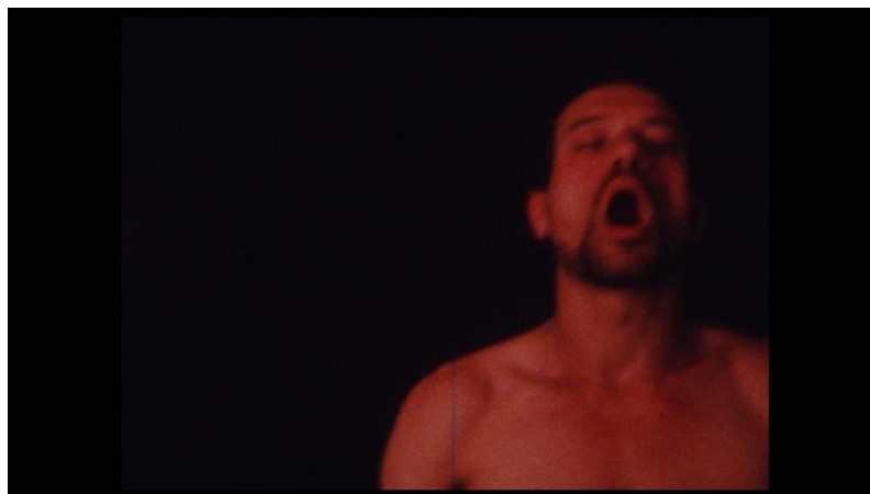
Figure 2 Michel Nedjar, Gestuel , 1978, Super 8, coul., son., 20 min. © Michel Nedjar