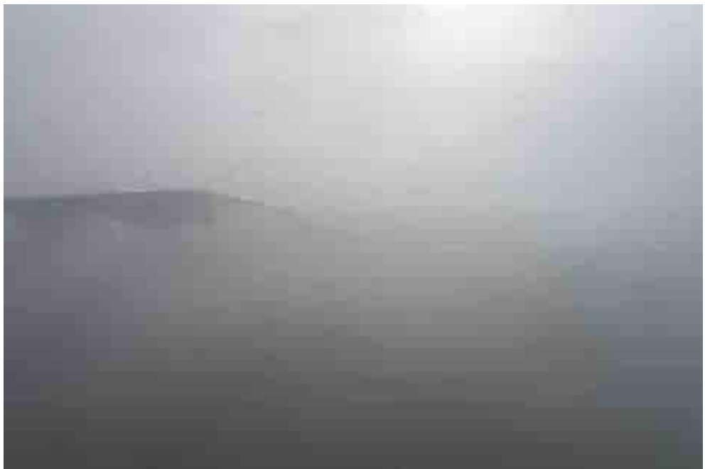
Figure 3. Delphine Lermite, Histoire(s) de l'œil , Kaiserkrone, 180524 # 1789 / 8042, photogramme time-lapse , 2018.