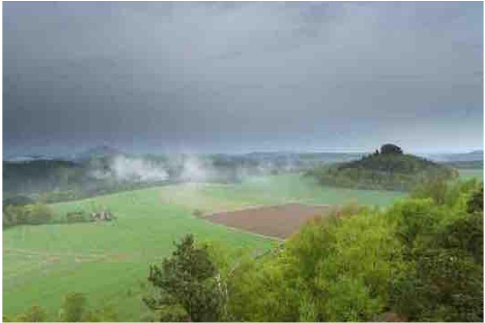
Figure 2. Delphine Lermite, Histoire(s) de l'œil , Kaiserkrone, 180523 # 0976 / 4044, photogramme time-lapse , 2018.

l'arrière-plan, la brume fit disparaître les champs et la nature verdoyante (Fig. 2 & 3).