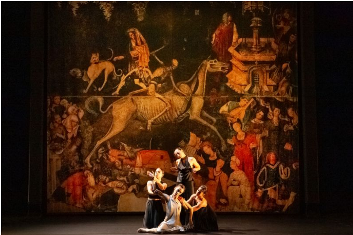
Fig. 4. Cie 111 - invisibili

tableau (Fig. 4), tantôt confrontée aux mêmes danseuses reconfigurées en doctresses maltraitantes. Le corps de Zampardi n'est plus qu'une chose malade et manipulable, soumise à un examen déshumanisant qui la met littéralement à nu. À bout de force, dans une extase de plusieurs minutes, la chair épuisée s'échoue sur le tableau dans une étreinte avec la mort elle-même. La danseuse, juchée sur la monture squelettique, disparaît peu à peu dans les plis du décor qui devient suaire (Fig. 5).