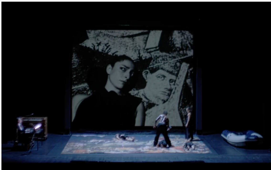
Fig. 10. Cie 111 - invisibili