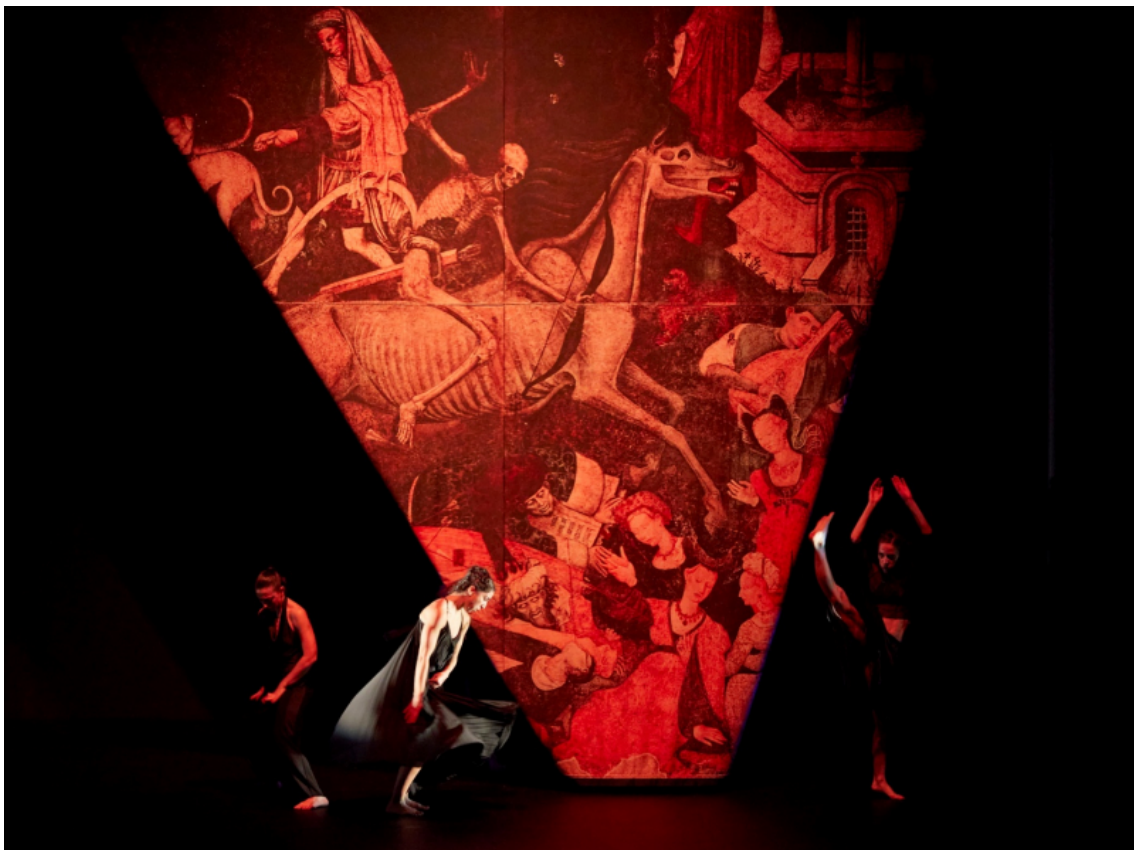
Fig. 9. The Skeleton Dance , Walt Disney