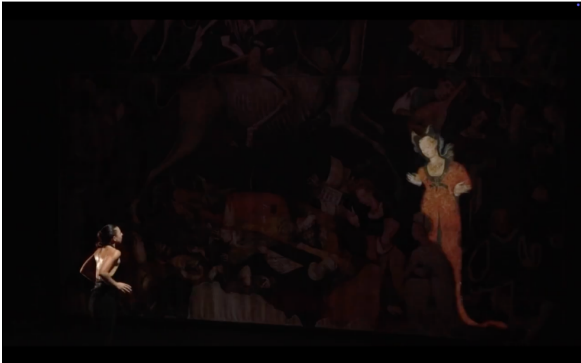
Fig. 6. Capture d'écran du teaser