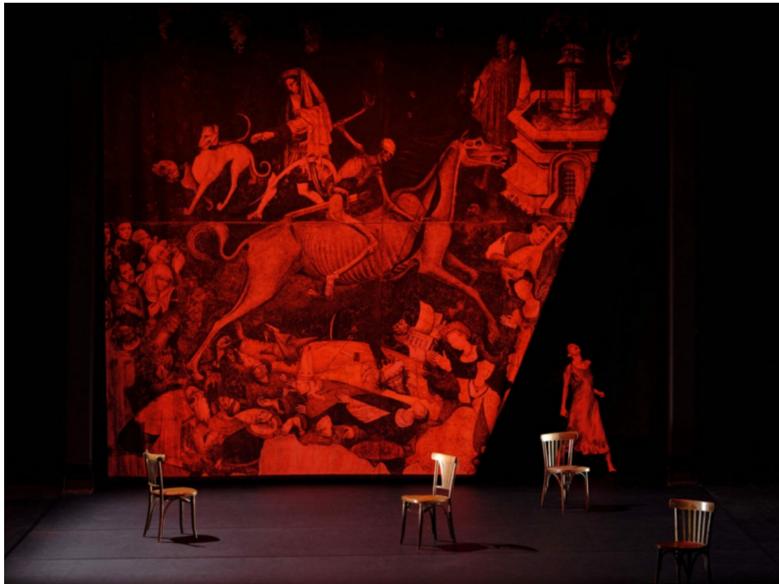
Fig. 11. Capture d'écran du teaser © Cie 111 - invisibili