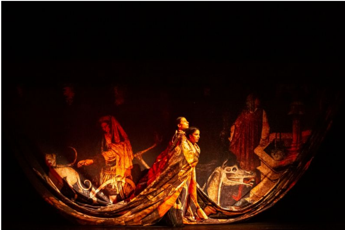
Fig. 2. Cie 111 - invisibili