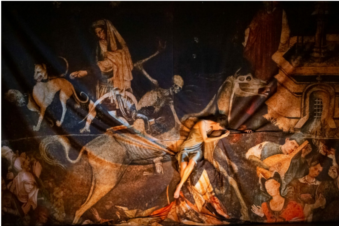
Fig. 5. Cie 111 - invisibili © Rosellina Garbo