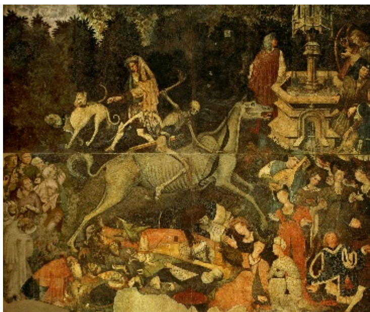
Fig. 1. Trionfo della Morte (1446), Galleria regionale di Palazzo Abbatellis, Palermo